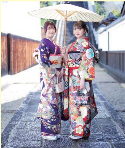
▲成人式の前撮りの様子