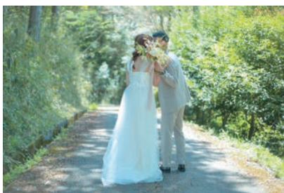
(取材・文 甲田智之)

ジョイ美容室の根底にあるのは「お客さんのライフスタイル・ライフスタイルに寄り添う」こと。カットして終わりではなく、その後の生活も見越してフォローしていく。撮影もお客さんの家族になった気持ちで、温度感や匂いまでカメラに収めたいんです、と理美さんは話します。美容室も撮影も、「寄り添う」という根底で通じ合っている。そんな直人さん理美さんのこだわりに憧れて「美容師になりたいです」という10代もいるほど。しかしジョイ美容室はまだまだ止まりません。理美さんは「まだまだやりたいことがたくさんあるんです」と今後の抱負を語ります。ジョイ美容室のこれからに目が離せません。